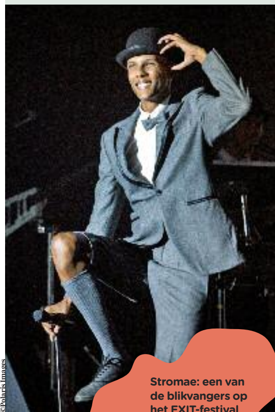
Stromae: een van de blikvangers op het EXIT-festival in Novi Sad.